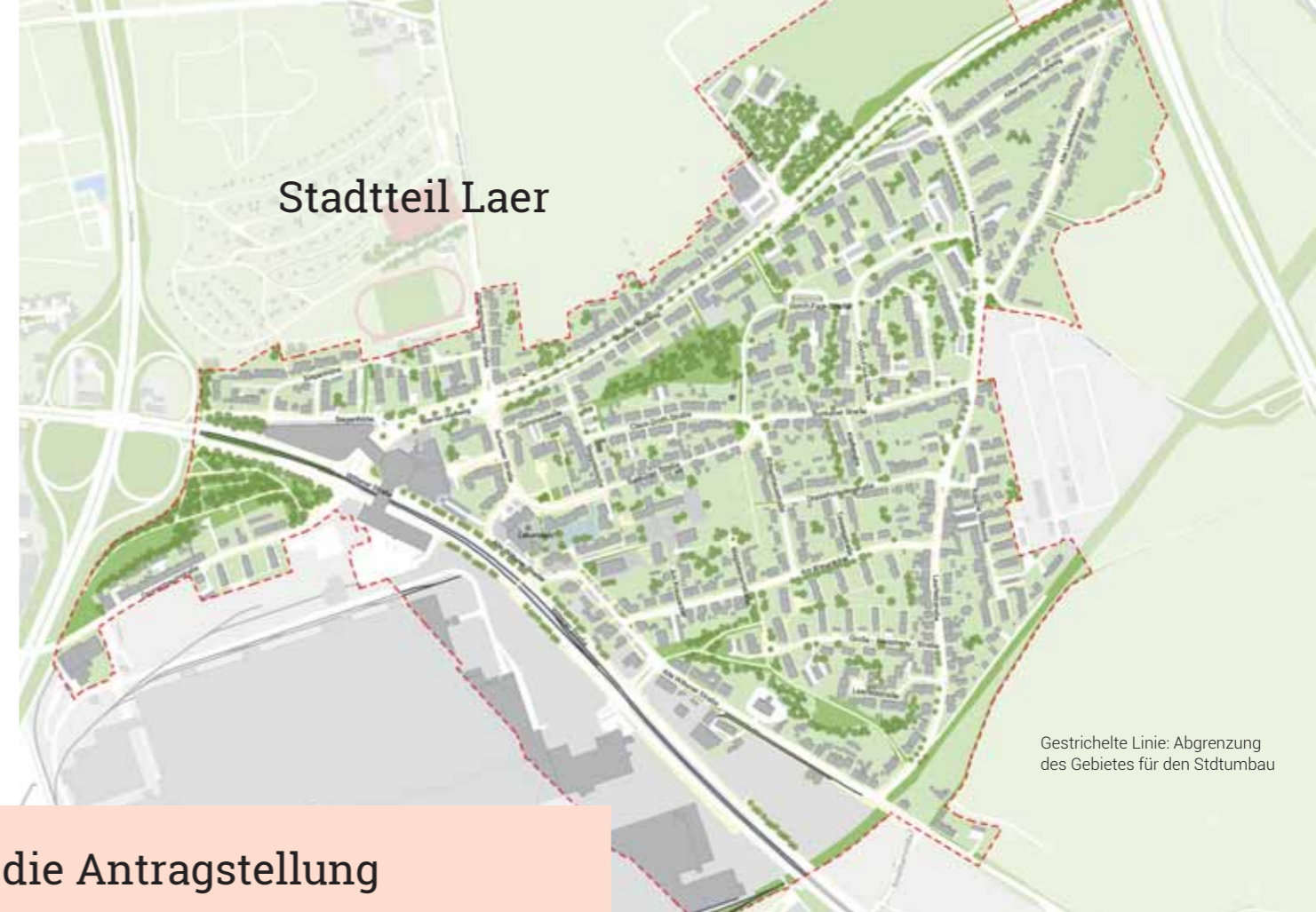
Gestrichelte Linie: Abgrenzung des Gebietes für den Stdtumbau