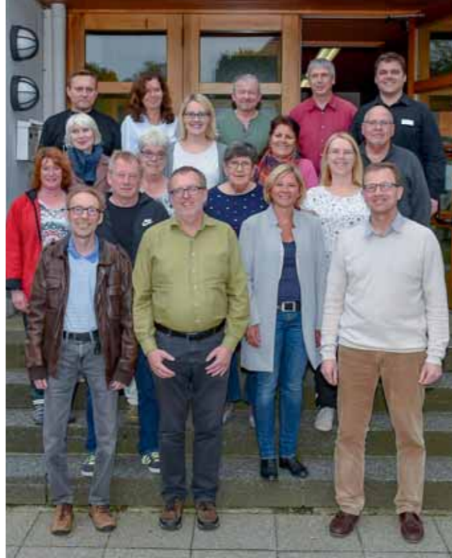
Die Mitglieder des Stadtteilbeirats entscheiden über die Bewilligung der Anträge.